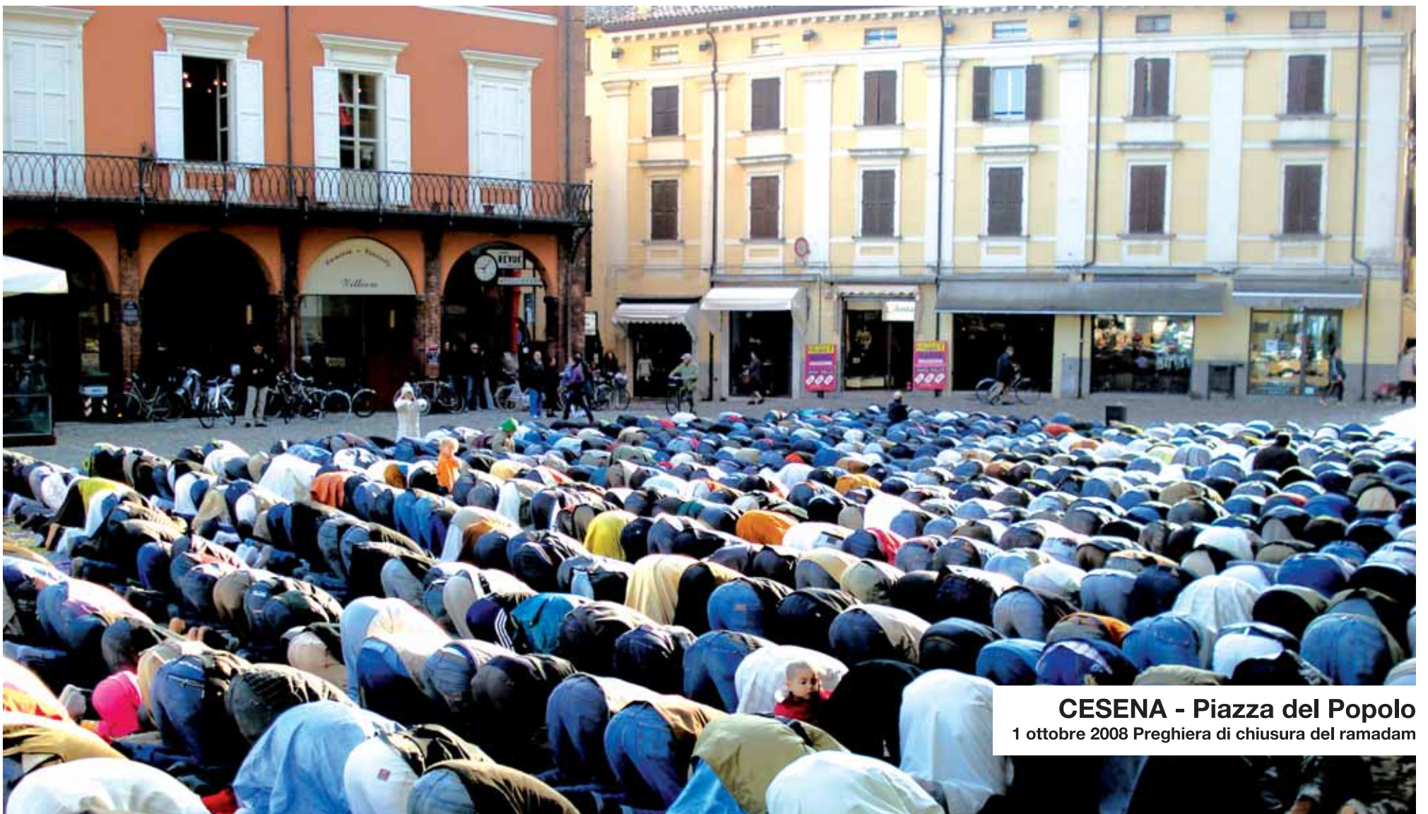
CESENA - Piazza del Popolo 1 ottobre 2008 Preghiera di chiusura del ramadam